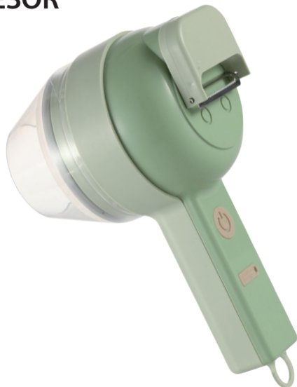
СХЕМА ДЕТАЛЕЙ НАБОРА ЭЛЕКТРИЧЕСКИХ ОВОЩЕРЕЗОК