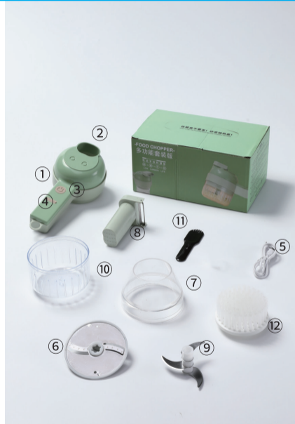
СХЕМА 1. ИСПОЛЬЗОВАНИЕ НАБОРА ЭЛЕКТРИЧЕСКИХ ОВОЩЕРЕЗОК