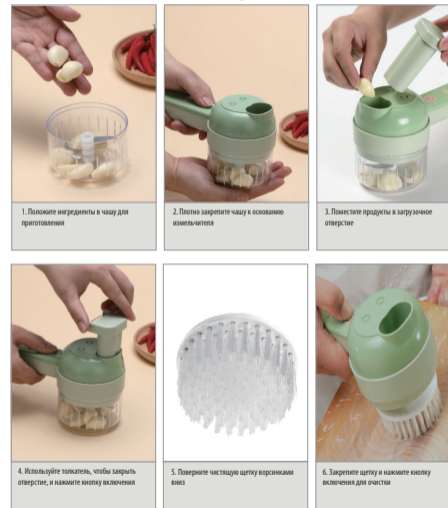
СХЕМА 2. ИСПОЛЬЗОВАНИЕ НАБОРА ЭЛЕКТРИЧЕСКИХ ОВОЩЕРЕЗОК

ПРИМЕЧАНИЕ: Будьте осторожны! Во избежание порезов, держите пальцы дальше от загрузочного отверстия.